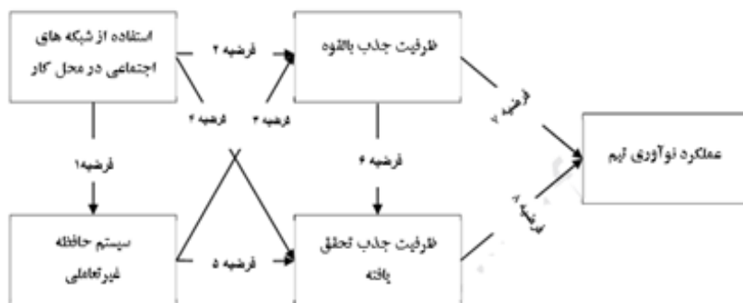
شکل ۱. مدل مفهومی تحقیق (احسن علی و همکاران، ۲۰۲۰)

بدین ترتیب فرضیه های مطالعه عبارت است از: